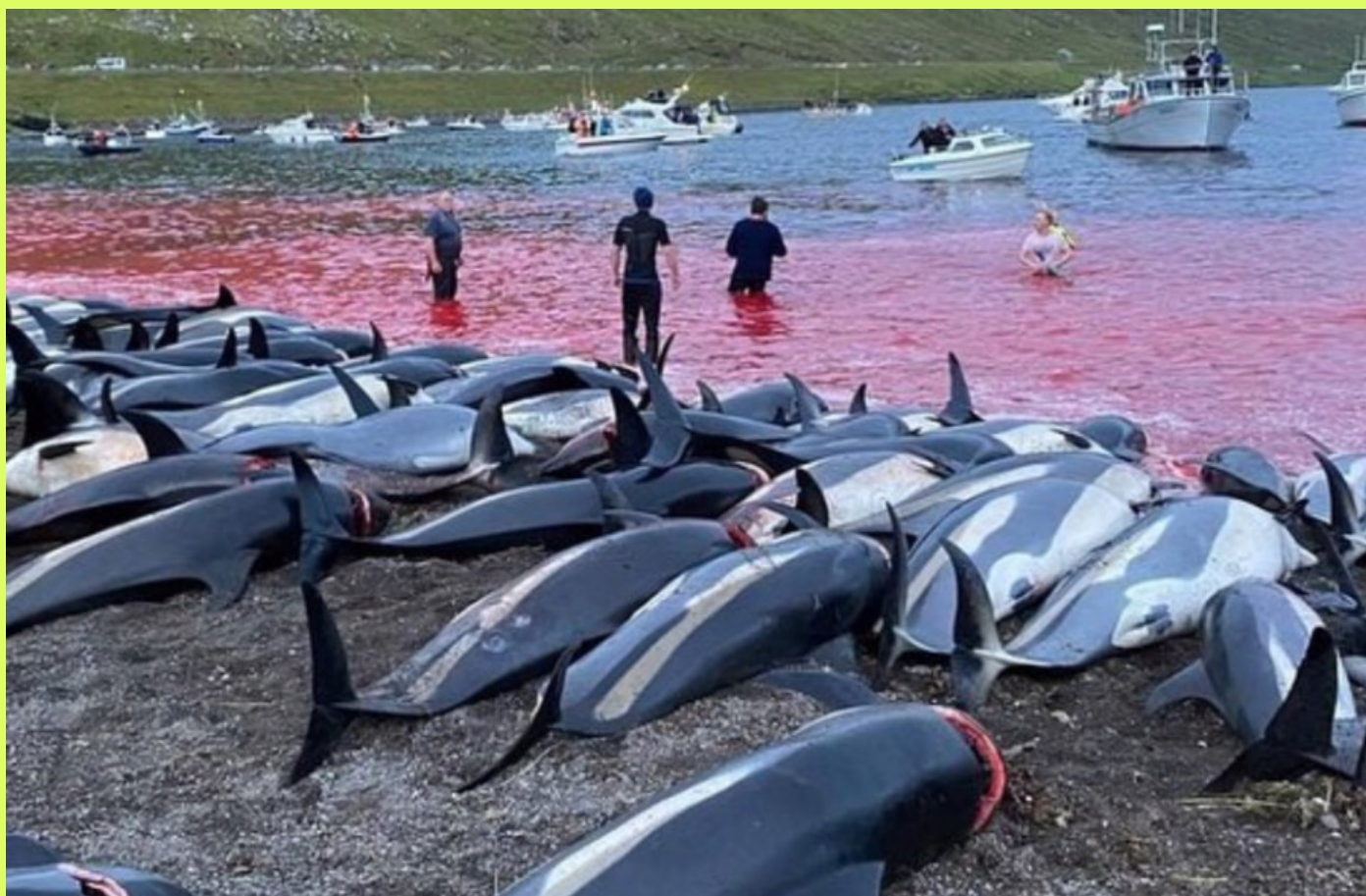
La cruenta mattanza delle balene e dei delfini alle isole Faroe nell'arcipelago danese.

La balena ha quindi acquisito una profonda connessione con il pianeta (sia mare sia terra). Anticamente la balena veniva trattata con il più grande rispetto e bisognava essere iniziati per poterla cacciare. Tutto questo suggerisce il potere che la balena ha sempre esercitato sull'umanità: ancora oggi può dare un grande contributo per la tutela dell'ecosistema e di tutti gli esseri viventi (umano compreso).